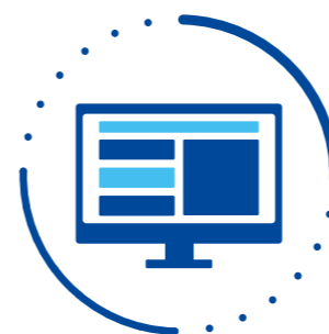
Il mio portale

Grazie all'interfaccia utente basata sul Web Il mio portale, ogni utente può configurare facilmente le impostazioni delle funzioni di telefonia e personalizzare la propria messaggistica unificata, anche senza conoscere il numero di ciascuna funzione specifica del PBX.