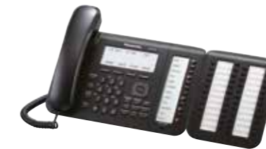
Foto: KX-NT556 con KX-NT505